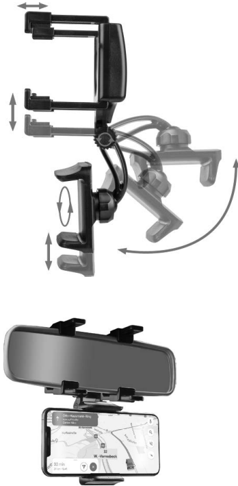
Figure 2 : montage

Accrochez les bras de fixation supérieurs (position 1 dans la vue d'ensemble) du support smartphone pour véhicule automobile par l'arrière sur le rétroviseur intérieur. Pour ce faire, tirez les bras de fixation inférieurs (position 3 dans la vue d'ensemble) hors du support smartphone jusqu'à ce qu'ils puissent entourer le rétroviseur intérieur. Orientez le support smartphone. Poussez les équerres de maintien (position 2 dans la vue d'ensemble) complètement contre le rétroviseur intérieur.