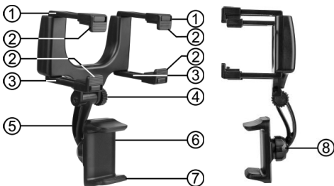
Figure 1 : vue d'ensemble